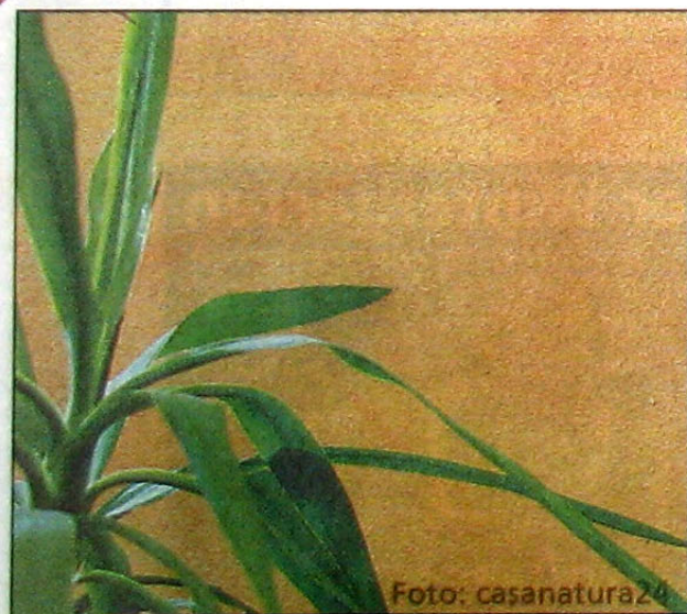
Strukturen machen Wände lebendig

Marmor- und Lehmputze mit ihren farbigen Oberflächen beeinflussen die Innenraumarchitektur und wirken durch die Regulierung der Luftfeuchtigkeit positiv auf das Raumklima. Die lebendige, sinnliche Struktur und die Farben dieser Art der Wandgestaltung waren noch nie so beliebt wie heute. Natürliche Putze können glatt oder rau verarbeitet werden. Dadurch wirken sie mal rustikal, dann wieder elegant.